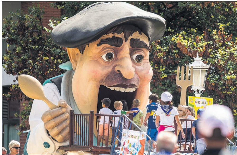
Gaur egun ezagutzen dugun Gargantua 1988an sortua da.

Nobedade moduan, Txikigunea aurten ahateen urmaela dagoen gune ezagunera zabalduko da, «familiak ingurune natural batean jai giroan murgildu daitezten». Beste nobedade bat da umeentzako eta familientzako kale-antzerki emankizunak Casilda Iturrizar parkeko pergoan egingo direla.