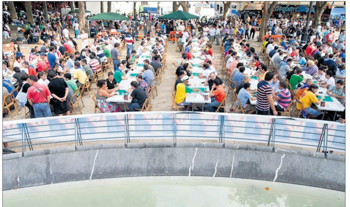
Itxura bikaina erakutsiko du Bilboko Areatzak datorren astearte arratsaldean.

Urteak atzera begira, sari politoagoak egon izan dira Mus