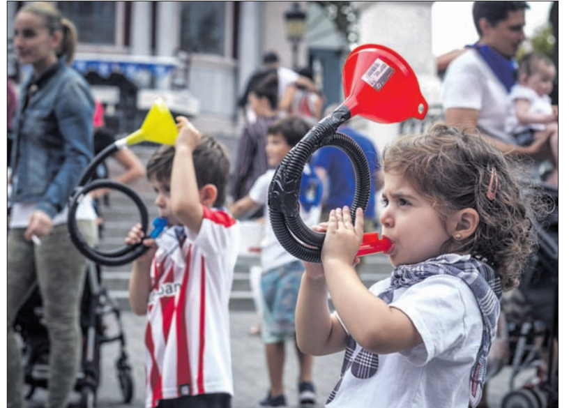
Karpaxo eta Mekanitxin pertsonaiek haurrentzat prestatutako ekitaldiak girotuko dituzte aurten, bigarren aldiz. Irudietan, iazko kalejira-tailerra eta serigrafia-tailerra.