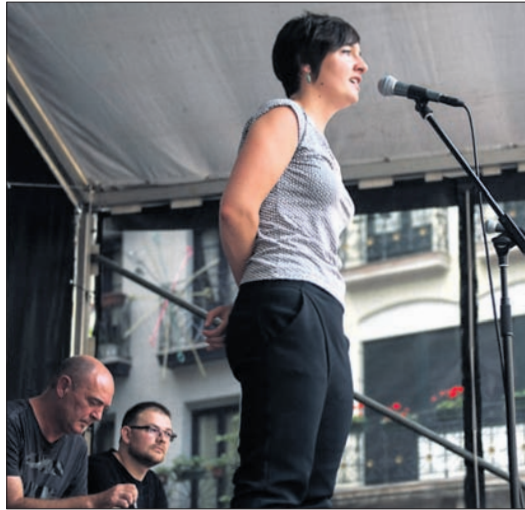
Santiago plazako bertso saioa.