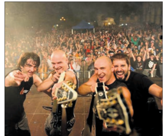
Su Ta Gar abre el cartel de Abandoibarra.