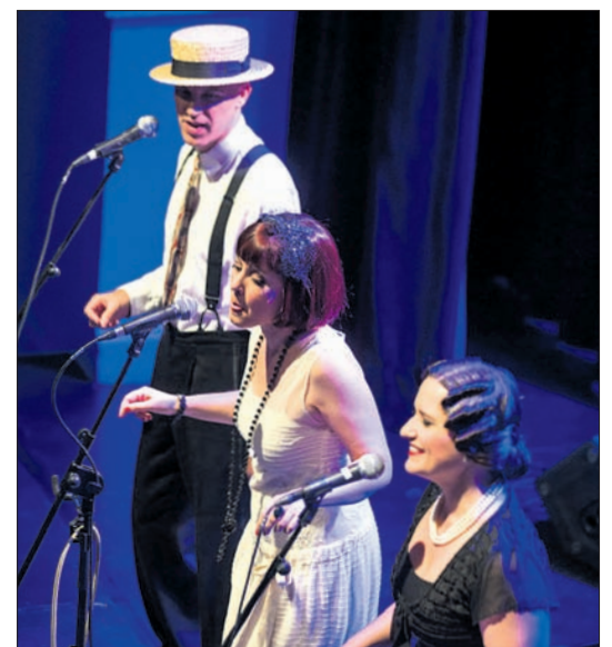
El swing de O'Sister llenará la plaza el lunes. GARA