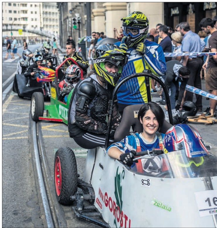
lazko edizioan hartutako bi irudi: helmugako giroa eta Jaitsiera Txikiko partaide ausart bat.

Udalak honako neurriak hartu ditu: zeinu-interprete bat jaien pregoian eta antzerki emanaldietan; irakurketa errazera eta brailera egokitutako egitaraua; lehenetsuneko tokiak kontzertuetan aniztasun funtzionala duten pertsonentzat eta komun egokituak jai eremu osoan.