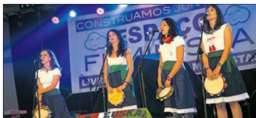
As Netas da Maurizia, ostegunean. GARA