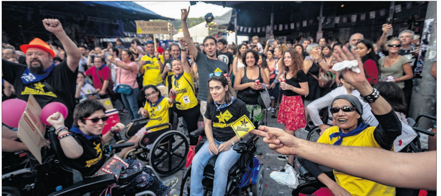
Bizkaiko «Bordillo aplastao» kolektiboaren eskakizunak presente izan ziren joan den urteko txupinazoan. GARA

Beste alde batetik, Bilboko leku estrategikoetan, jaietako egitaraua braillez eskainiko dute. Leku hauetan eskuratu ahal izango da: Bilbao Turismoren bulegoetan (Plaza Biribila, 1, behe, eta Guggenheim ondoko kasetan); ONCERen egoitzan (Perez Galdos, 11); aireportuko informazio puntuan; Bolsa eraikineko udaltegian; Txikiguneko informazio puntuan; eta Abandoko Udaltegian (Elkano kalea, 20).